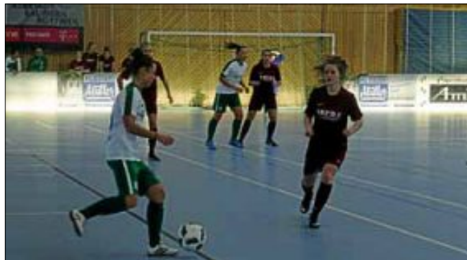
Bezirksmeisterschaften Rems Murr Futsal Pelada 15.01.2017 Sporthalle Rommelshausen mit SV Hegnach II