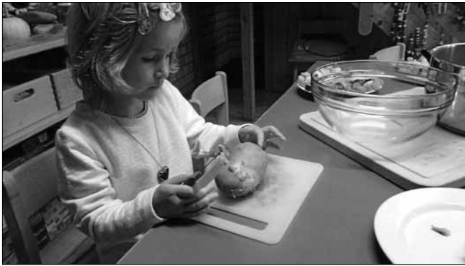
Konzentriert am Werk!