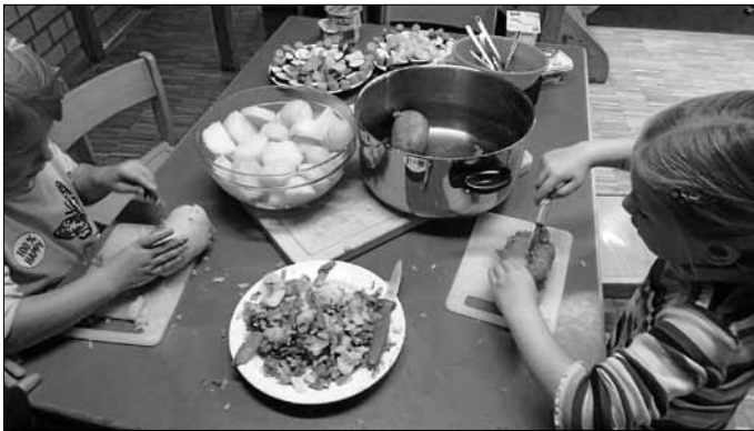
"Essen ist bald fertig...!"