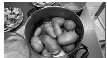
Prachtvoll und geschmackvoll: Kartoffeln aus Hegnach

Am Freitag haben wir die Kartoffeln dann gewaschen, gekocht und geschält.