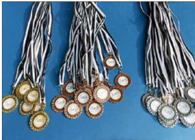
Die Medaillen - jeder hätte sie gern