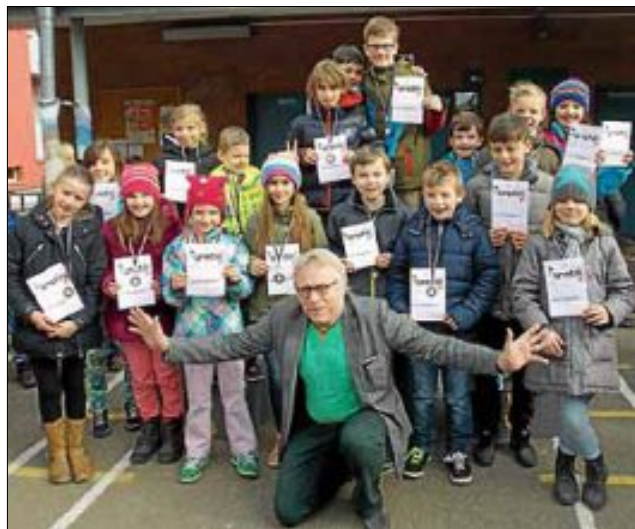
Die besten Turnerinnen und Turner der Burgschule 2016