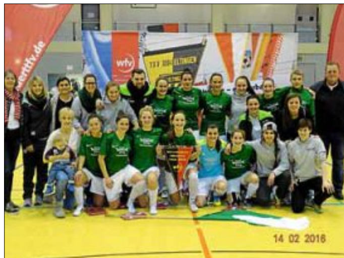
WÜRTTEMBERGISCHER MEISTER 2016: SV HEGNACH