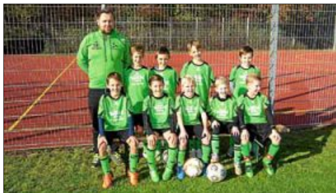
E3-Junioren SV Hegnach