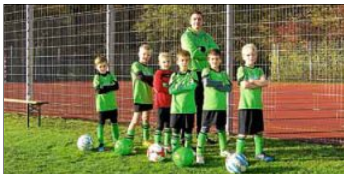
F-Junioren SV Hegnach

Mannschaftsfotos unserer F- und E- sowie A-Junioren: