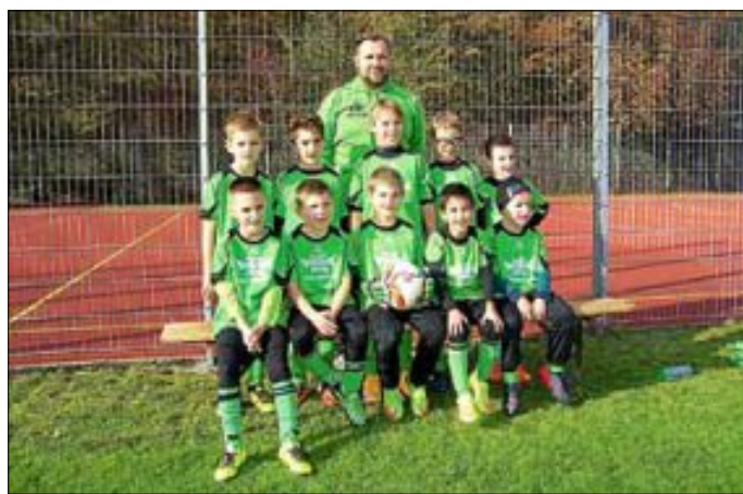
E2-Junioren SV Hegnach