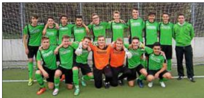
A-Junioren SV Hegnach