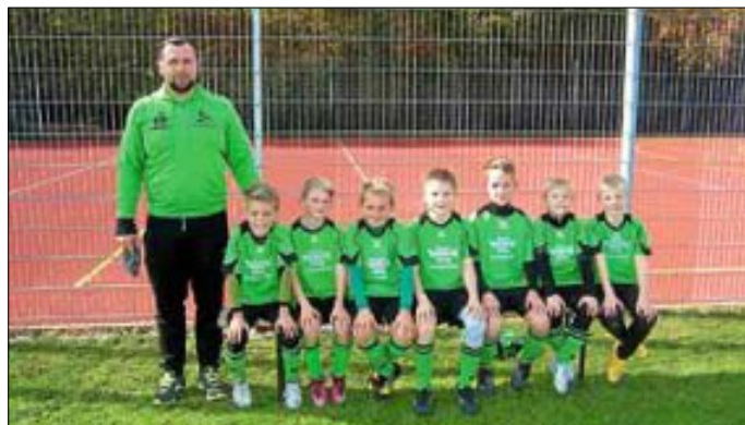
E1-Junioren SV Hegnach