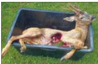
Was passieren kann, wenn ein Hund nicht angeleint wird, sehen Sie anhand dieses Bildes.