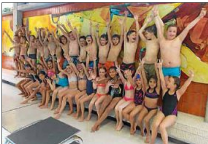
Erfolgreiche Sportkinder der Burgschule