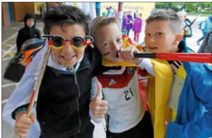
Die Stimmung war gut