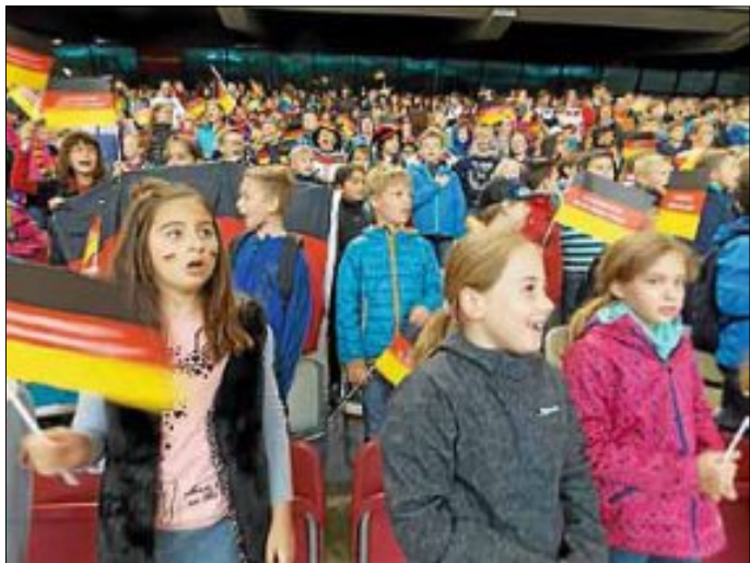
Burgschulkinder im Stadion bei der Nationalhymne