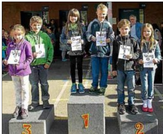
Die besten Turnkinder der Klassenstufe 2