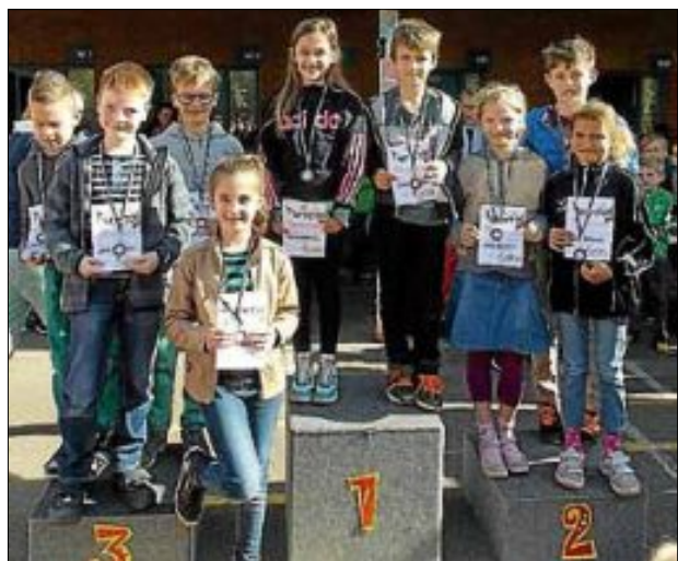
Die besten Turnkinder der Klassenstufe 3