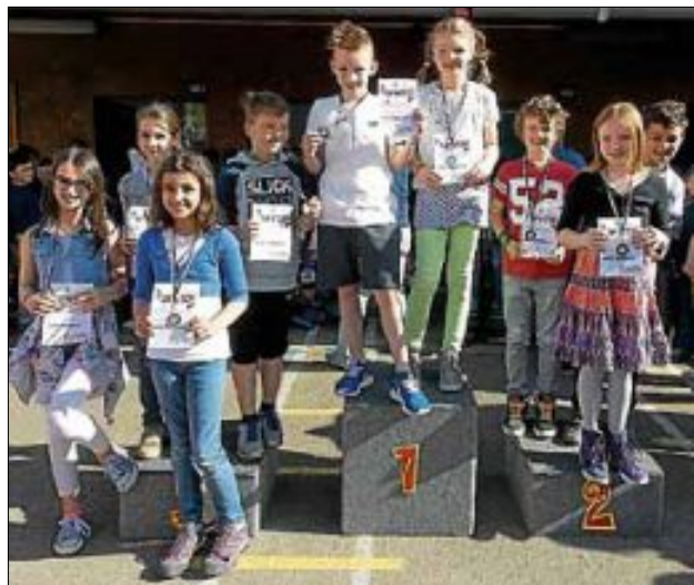
Die besten Turnkinder der Klassenstufe 4