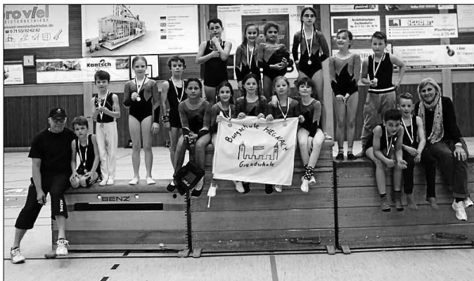
Turnteam der Burgschule