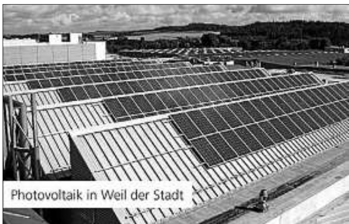
Photovoltaik in Weil der Stadt

Deshalb ließ Brigitte Nussbaum im Sommer 2011 auf den Dächern der Betriebe Weil der Stadt, Rottweil und Uhingen sowie der Außenstelle Dußlingen Photovoltaikanlagen aus deutscher Herstellung installieren. Die Anlagen produzieren zusammen rund 181.000 Kilowattstunden jährlich, was dem durchschnittlichen Stromverbrauch von 40 Einfamilienhäusern entspricht. Zudem wird der Ausstoß von Kohlendioxid um jährlich etwa 14 Tonnen verringert.