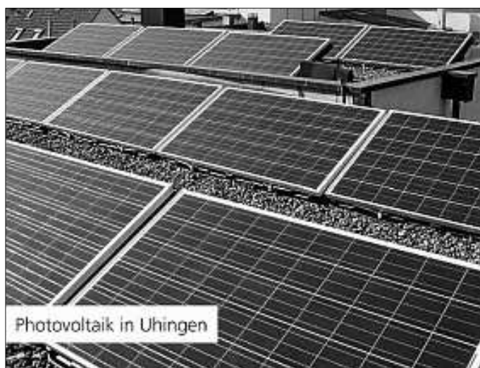
Photovoltaik in Uhingen