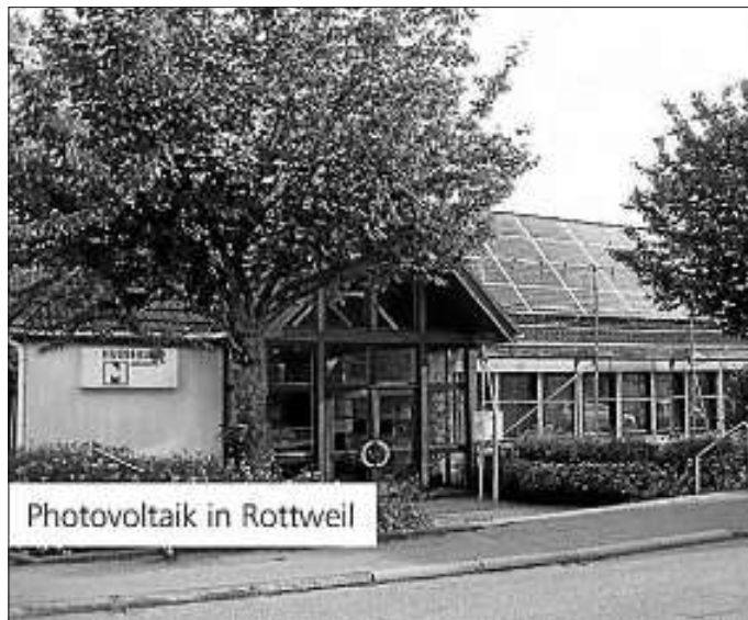
Photovoltaik in Rottweil

Die Familienbildungsstätte bietet zum zweiten Mal in Kooperation mit dem Waiblinger Frauenrat und dem FraZ – Frauen im Zentrum MammaCare-Kurse zur Brustselbstuntersuchung an vier Abendterminen an: dienstags, 14. und 21. Oktober 2014, von 18 Uhr bis 19.30 Uhr und Dienstag, 20. Januar, und Mittwoch, 21. Januar 2015, jeweils von 19.30 Uhr bis 21 Uhr. Die Kursgebühren betragen 30 Euro, einige Krankenkassen erstatten die Gebühr. Interessierte können sich im Vorfeld bei ihrer Krankenversicherung informieren. Bei Fragen und zur Anmeldung wenden sich die Teilnehmerinnen direkt an die Familienbildungsstätte, Telefon 07151 98224-8920.