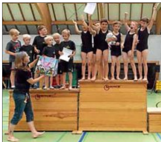
Hurra! Wir sind Turniersieger!