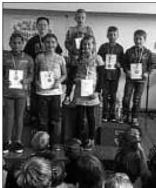
Medaillengewinner Klasse 3