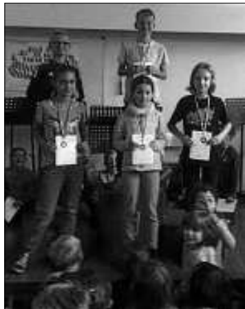
Medaillengewinner Klasse 4. Es fehlt auf dem Bild Philipp Herterberger