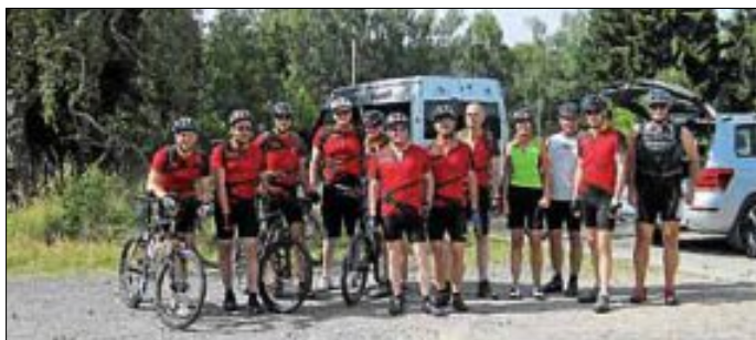
Radsportgruppe Ski-Club Hegnach e.V.

- Treffpunkt im Sommer am Eingang zum Hartwald.