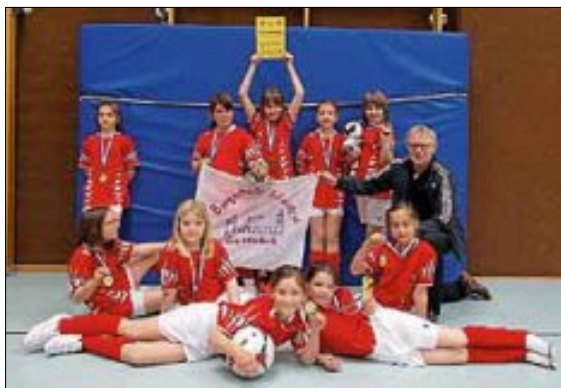
Fußball-Mädchen der Burgschule 2014

Mehr Bilder gibt es auf unserer homepage: www.burgschule-hegnach.de