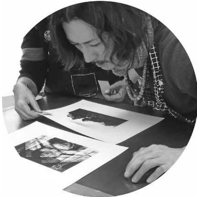
Für Fototiefdruck auf Solar-Platte