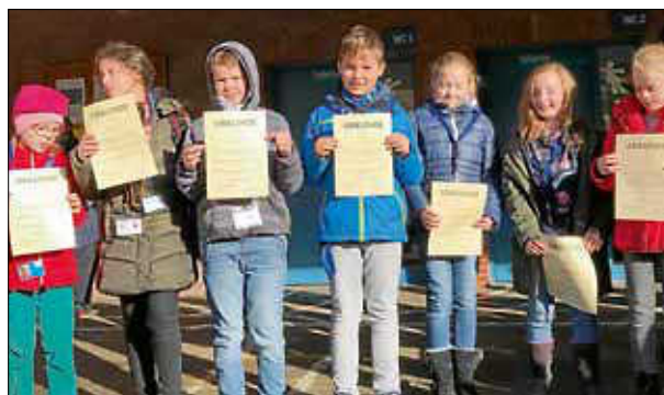
Die Streitschlichter der Burgschule