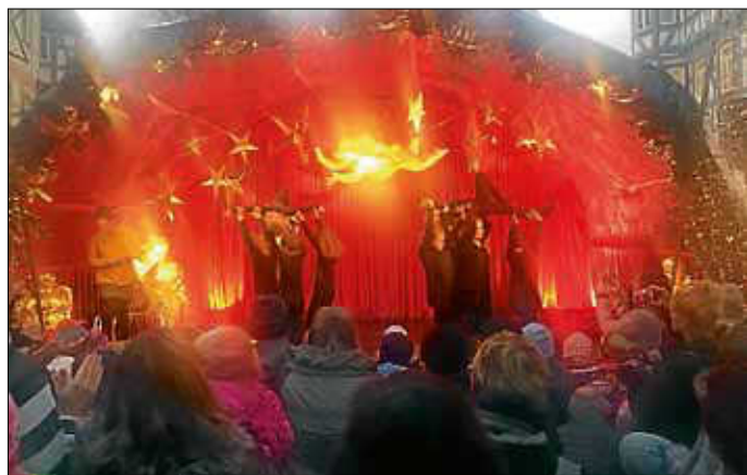
Sternenglanz zu "Der König der Löwen"