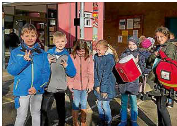
Die Juniorhelfer der Burgschule

Liebe Juniorhelfer, liebe Streitschlichter, vielen Dank, dass ihr regelmäßig bereit seid euer Spiel in der Bewegungspause zu unterbrechen sobald ihr gebraucht werdet!!! Ihr seid super!