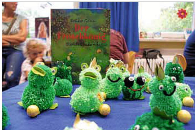
Der Froschkönig als Pompom-Figur ... eines der vielen Projekte zum Thema Märchen

Rückblick auf das Schuljahr 2017/18: Schulfest und Projekttage