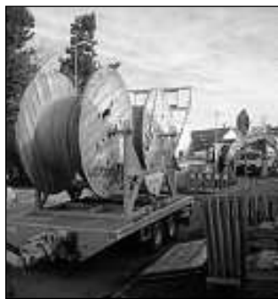
Im März gestartet - Glasfaserausbau der Stadtwerke Waiblingen im Gewerbegebiet „Lachenäcker“.

Ein Gebäude kann bereits ab 2.500 Euro angeschlossen werden (Pauschalpreis bis zehn Meter im Grundstück des Eigentümers, zuzüglich Umsatzsteuer). Der Kooperationspartner der Stadtwerke, die NetCom BW, bietet für die ansässigen Gewerbetreibenden leistungsstarke Dienste für Internet und Telefonie an. Mit der Nutzung von Glasfasertechnologie positionieren sich Firmen bereits heute zukunftssicher für die Industrie 4.0 und die steigenden Belange der Datenübertragung. Bei allen Fragen zum Thema Glasfaser ist die NetCom BW telefonisch erreichbar unter 0800 3629 252 oder per E-Mail an keyaccount@netcom-bw.de .